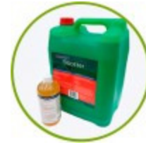
Carbon Kick booster