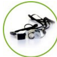
Luupit ja mikroskoopit