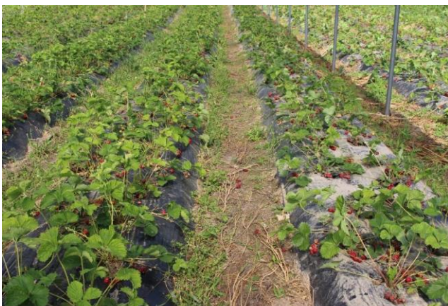
Prestop upotuskäsittely istutusvaiheessa ja kastelu 250 g/1000 kasvia noin 1 kk kuluttua istutuksesta.

Prestop on saatavilla 100 g ja 1 kg pakkauksissa. Tuote säilyy avaamattomana 12 kk viileässä, alle +8°C.