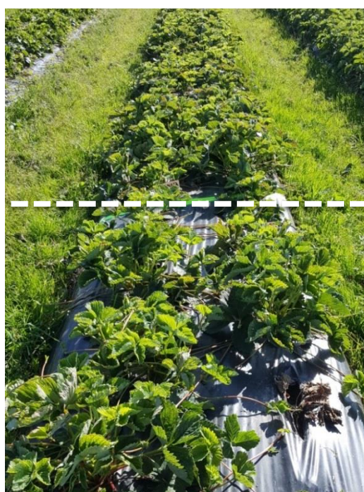
Sonata (A+) edessä käsittelemättömiä, takana Prestop-upotuskäsiteltyjä.