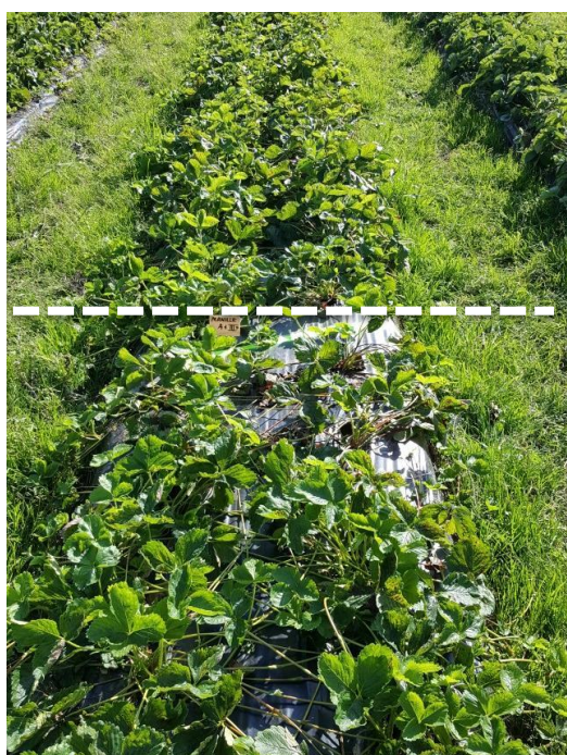
Manille (A+) edessä käsittelemättömiä, takana Prestop-upotuskäsiteltyjä.

Koe perustettiin keväällä 2017 kaupalliselle viljelmälle usealla eri mansikkalajikkeella. Frigo-taimet upotettiin nopeasti 0,5 % Prestop-vesiseokseen juuri ennen istutusta. Alla olevat kuvat on otettu noin 3 kk istutuksen jälkeen. Kokeessa kerättiin myös satotulokset, joissa keskimääräinen sadonlisä eri lajikkeilla oli 6,8 %.