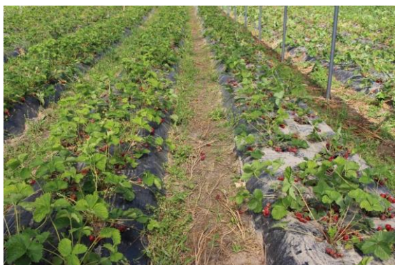
Prestop dopningsbehandling i planteringskedet och bevattning 250 g/1000 plantor cirka 1 månad efter planteringen

Prestop finns att få i förpackningar om 100 g och 1 kg. Produkten är hållbar 12 månader i oöppnad förpackning om den förvaras svalt, under +8° C.