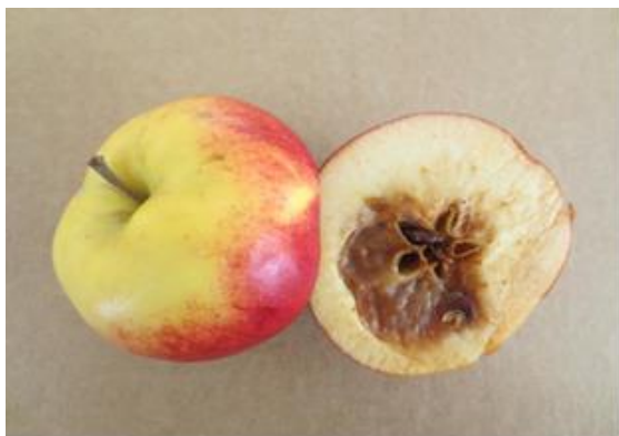
Symptom på kärnhusröta på sorten Santana

Prestop Mix finns att få i förpackningar om 1 kg och 400 g. Förvaras svalt och torrt, håller sig 12 mån. i oöppnad förpackning under +8°C. En öppnad förpackning håller sig 1 månad om den försluts på nytt och förvaras under +8°C.