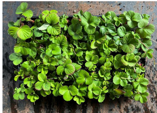
Prestop + Lalstim Osmo

Kokeessa havainnoitu 132 juuristoa/koejäsen