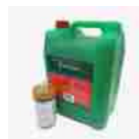
Carbon Kick Booster