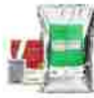
Biologiska preparat mot sjukdomar